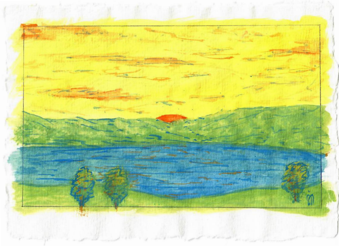
Aquarell von Joël Méndez mit den Farben des Aargauer Aquarellkastens gemalt

Wenn Menschen sich in einer Landschaft geborgen fühlen, wird diese zur Heimat. Wir freuen uns, wenn wir unseren Gästen während ihrem Aufenthalt dieses Gefühl vermitteln können.