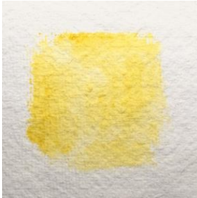
Wettiger Schüttgelb aus dem Aargauer Aquarellkasten