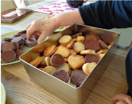
Aargauer Rübli Orange aus dem Aargauer Aquarellkasten

So gestalten wir die Auszeit in der Tagesstätte. Unsere Fachpersonen beachten dabei sorgsam das individuelle Befinden der Tagesgäste. Die Würde, die Sicherheit und das Wohlbefinden sind dabei die leitenden Werte.