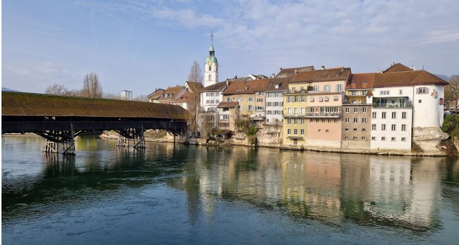
«Alte Brücke» in Olten.