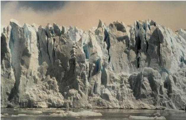
Der Gletscherabbruch vom Gletscher Perito Moreno, welcher im Lago Argentino endet.

Die südlichste Stadt der Welt ist Ushuaia, Hauptstadt der Provinz Feuerland. Diese liegt am Beagle Kanal und bildet das südliche Ende der langgestreckten, dünnbesiedelten Region Patagonien. Patagonien ist bekannt für ihre majestätischen Landschaften, Flüsse und Fjorde, die unendliche Weite der patagonischen Steppe und die riesigen Gletscher. Vor allem die Gletscher um die Stadt El Calafate haben mich in den Bann gezogen. Einer davon ist der Gletscher Perito Moreno, welcher auf ca. 3000 m beginnt und nach 30 km auf wenigen Metern über Meer im Lago Argentino endet. Der Gletscherabbruch ist mit 5 km Breite und einer Höhe von ca. 60 m einzigartig. Impassant diese Eiswand, wenn man im