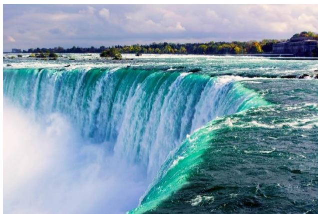
Niagarafälle – eines der unzähligen Naturwunder.