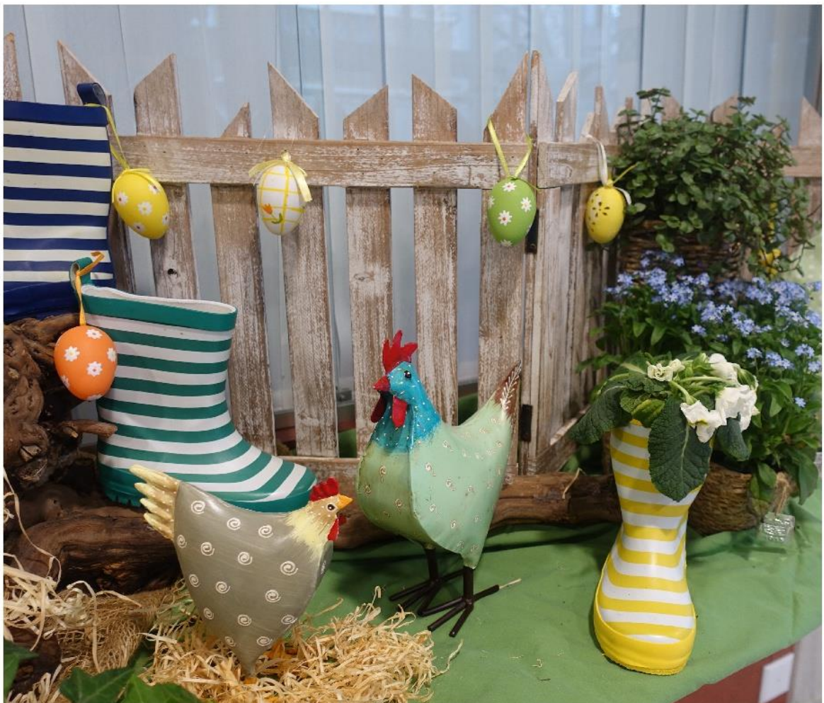
Frühlingsdekoration im Falkenstein.

Tel: 062 765 80 00 info@falkenstein-menziken.ch www.falkenstein-menziken.ch