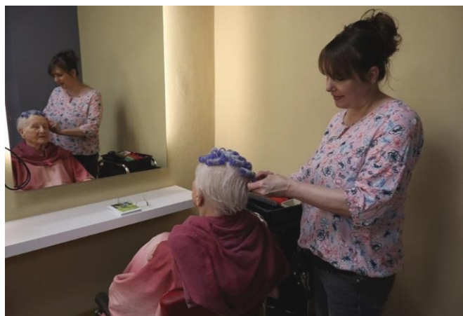
Waschen, legen, föhnen gehört genauso zum Coiffeur-Handwerk wie auch das Zuhören, Erinnerungen austauschen und gemeinsam über etwas zu lachen.