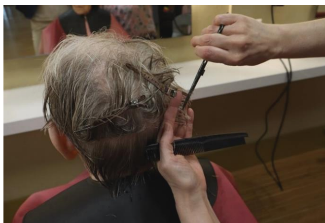
Jeder Handgriff sitzt.