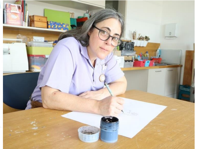
Wimmelbild Falkenstein – gezeichnet von Barbara Lang, Aktivierungsfachfrau Abteilung E.

Wer in letzter Zeit einen Blick auf unser neues Wimmelbild geworfen hat, hat es vielleicht schon gemerkt: Dieses Bild ist kein gewöhnliches Bild. Es ist ein kleines Universum voller Szenen, Figuren und Geschichten – und eigentlich kann man es nie nur einmal anschauen. Jedes Mal entdeckt man etwas Neues.