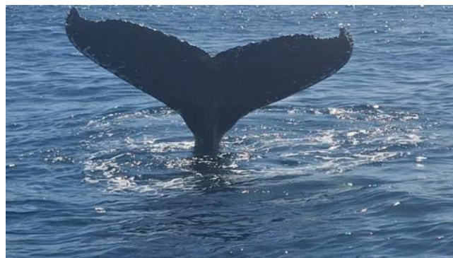
Die riesige Flosse des Gattwals ragt aus dem Wasser.

An der Ostküste Argentiniens erlebte ich ein Spektakel sondergleichen, etwas völlig Ausserordentliches. Ich hatte das Glück und konnte über mehrere Tage hinweg dutzende Gattwale vom Land, wie auch gefährlich nahe vom Boot aus, beobachten. Diese riesigen Säugetiere werden gut und gerne 100 Jahre alt, sind bis zu 18 m lang und haben ein Gewicht von bis zu 60 Tonnen. Futterbedarf pro Tag: sagenhafte 1000 bis 2000 kg. Die eindrucklichen Bilder, wenn mehrere dieser Meeressäuger gleichzeitig in die Luft schiessen, das anschliessende Abtauchen, das elegante ästhetische Spiel mit den Flossen, sind kaum zu beschreiben. Unvergessliche Eindrücke, welche diese Kolosse bei mir bis heute hinterlassen haben.