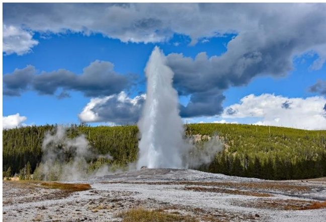
Geysir – ein ganz besonderes Spektakel.

Allein im Yellowstone Nationalpark sind von diesen natürlichen «Spritzbrunnen» etwa 500 aktiv. Im Erdinneren, in etwa 2000 m Tiefe und mehr, gibt es eine enorme vulkanische Aktivität. Dadurch wird das Grundwasser stark erhitzt und ein riesengrosser Druck baut sich auf. Ist der Druck gross genug, schießt das Wasser eindrucklich an die Oberfläche – und das Schauspiel beginnt von Neuem. Der bekannteste Geysir ist wohl der Old Faithful. Alle etwa 70 Minuten schleudert dieser das 70 Grad heisse Wasser dampfend 55 m in die Luft. Der Geysir namens Steamboat weniger oft, doch sogar über 110 m hoch (Weltrekord). Die Seen, die durch diese Naturwunder entstanden sind, leuchten in einer unbeschreiblichen Farbenpracht. Die natürlich entstandenen Gelände rund um diese Geysire sind weiss und werden als Kalksteinterrassen wahrgenommen.