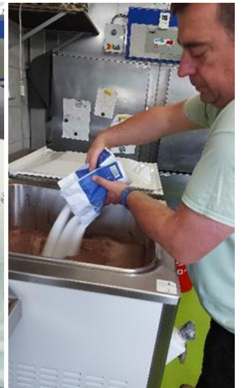
Die verschiedenen Zutaten werden der Milch beigefügt.