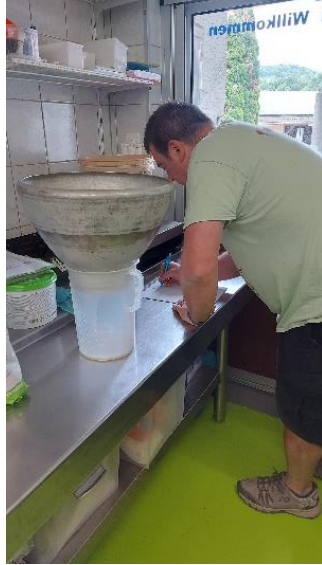
Für die Glaceproduktion wird die frisch gemolkene Kuhmilch gefiltert, abgefüllt und abgewogen.