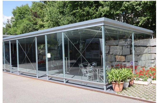
Der Mofa- und Elektromobil-Unterstand mit Raucherlounge ist fertiggestellt.

Nun ist es endlich soweit: Ab sofort kann der gedeckte neue Mofa- und Elektromobil-Unterstand sowie die Raucherlounge beim Haus B benutzt werden. Für Mitarbeitende gilt somit, dass das Rauchen nur in der neuen Raucherlounge sowie beim Raucherpoint auf der Cafeteria-Terrasse Haus C erlaubt ist. Das Fumoir ist ausdrücklich für Bewohnende und Besucher reserviert.