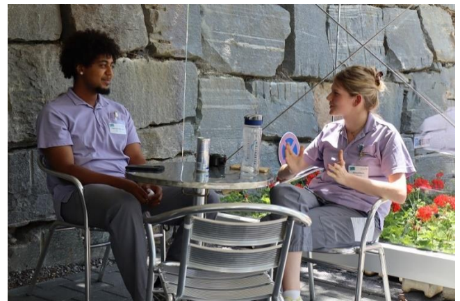
Auch ohne zu rauchen können Mitarbeitende in der Raucherlounge ihre Pausen verbringen.