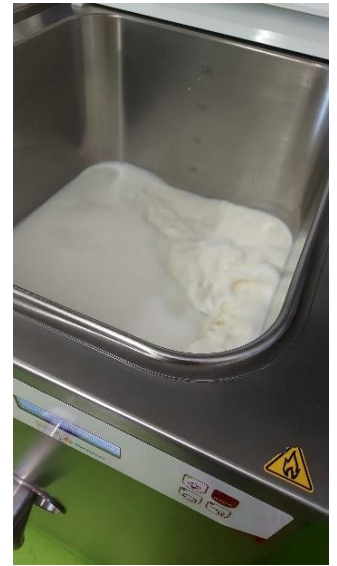
Die Milch wird auf 85°C erhitzt und danach schnell wieder auf 4°C abgekühlt.