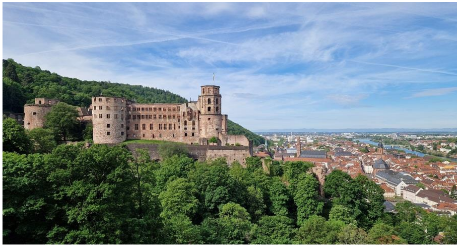
Schloss Heidelberg am Neckar.