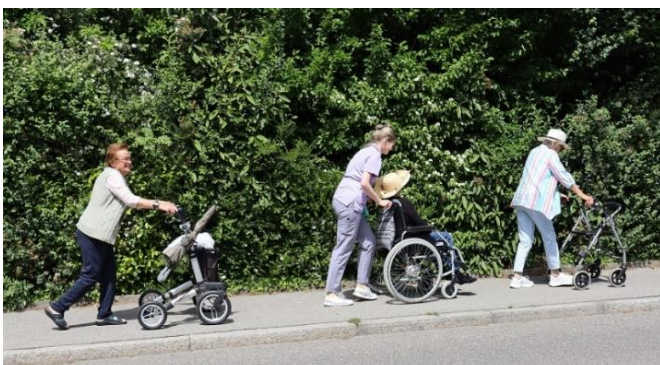
Der Anstieg wurde hervorragend gemeistert.