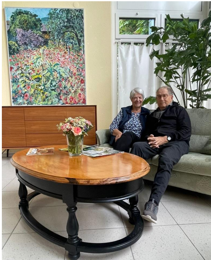
Hier lässt es sich verweilen: Neu gestaltete Gartenhalle Haus B.

In der Gartenhalle Haus B ist eine gemütliche Verweilecke entstanden. Hier kann man es sich bequem machen, lesen, plaudern oder sich einfach etwas ausruhen.