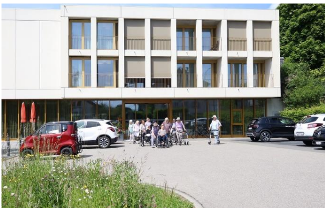
Die spazierfreudigen Bewohnenden versammelten sich beim Eingang Haus C.