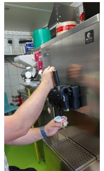
Die Glace wird in Becher abgefüllt.