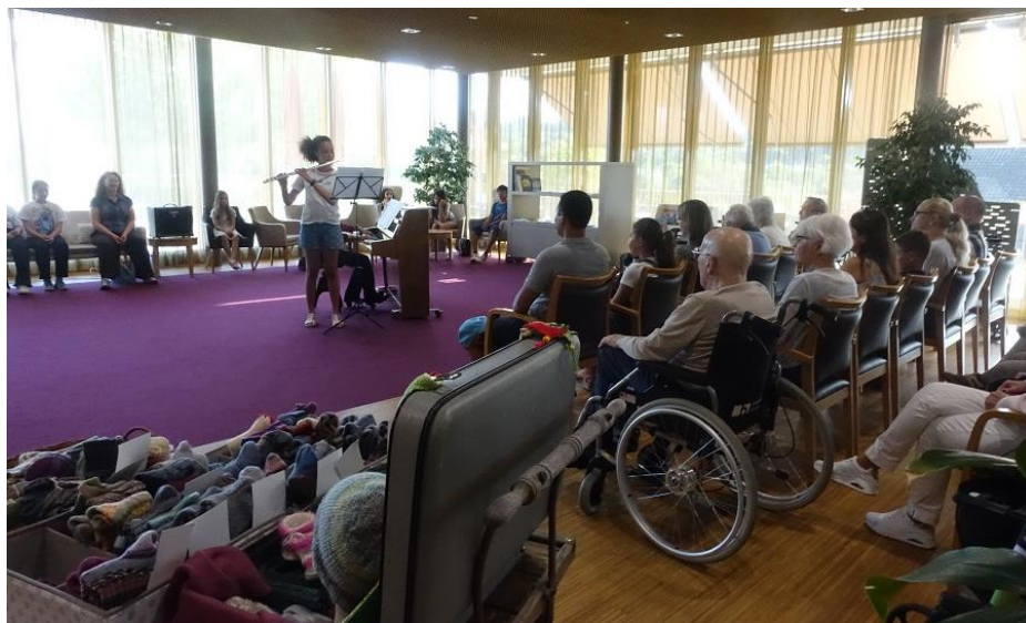
Die musikalischen Darbietungen der Musikschüler von Menziken und Reinach waren beeindruckend.

Am Freitag, 22. Mai 2026, führte die Musikschule Menziken/Reinach den m-Check im Falkenstein durch. So kamen die Bewohnerinnen und Bewohner in den Genuss der musikalischen Darbietungen der talentierten Musikschülerinnen- und -schüler.