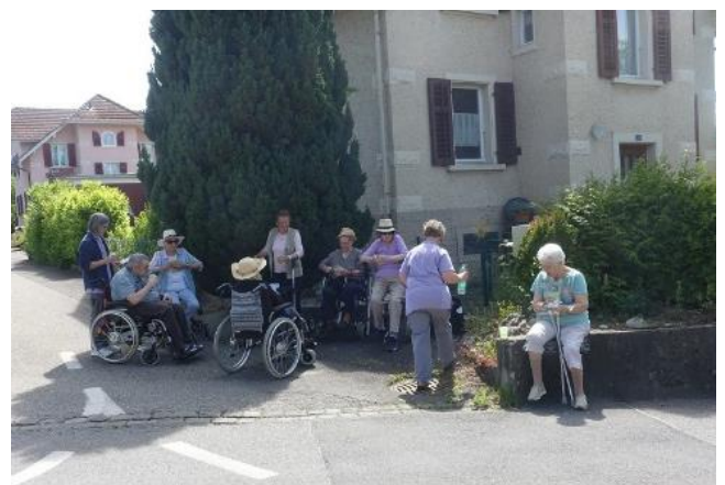
Eine kleine Verschnaufpause mit Getränken, Gesprächen und Mitsprechgedichten.